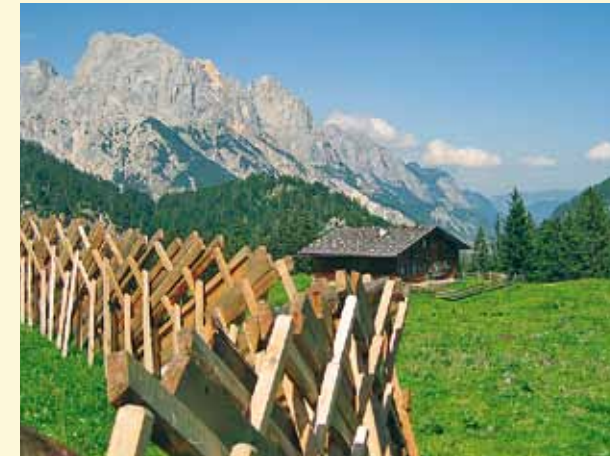
Almen im Spannungsfeld zwischen Naturschutz, Tourismus, Tradition und Nutzungsaufgabe