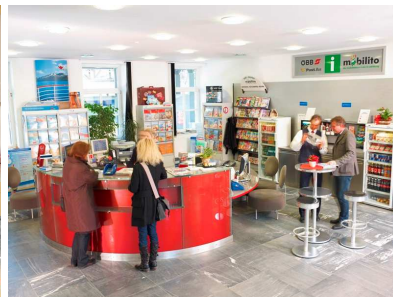
Eines der modernsten ÖV-Kundenzentren in Österreich am Bahnhof Bischofshofen